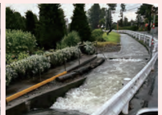
溢水する用水路（中沢堰）