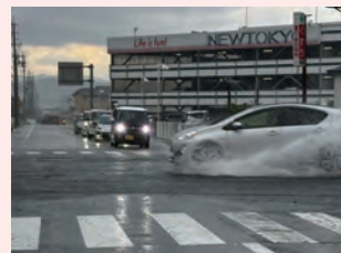
道路冠水状況（安曇野市三郷）

去る8月13日夕方、管内北西から突如湧いたゲリラ豪雨により、野沢雨量計（安曇野市三郷）が1時間雨量55ミリを計測しました。事前に用水路の水を減水しておいたにもかかわらず、小堰は溢れ主要水路も溢れそうなギリギリの事態となりました。このような降り方は、宅地や道路等の水が用水路へ一気に流入し急激な増水となるため、注意が必要です。